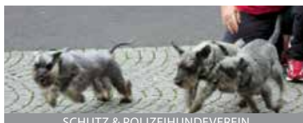
SCHUTZ & POLIZEIHUNDEVEREIN