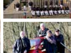
HEY TEACHER II BAND