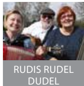
RUDIS RUDEL DUDEL