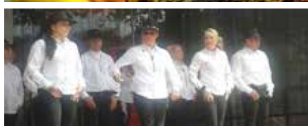
COUNTRY FREUNDE EN